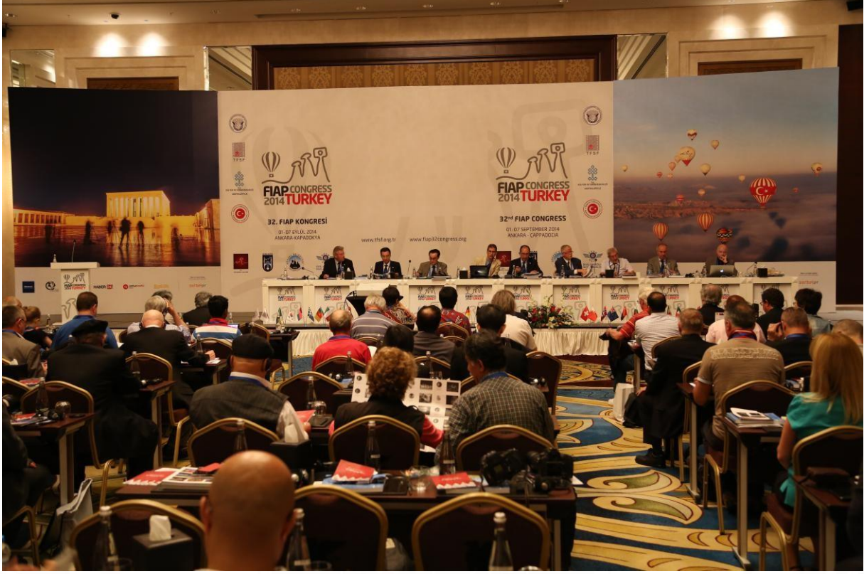
FIAP Kongresi Türkiye - Ankara - 2014