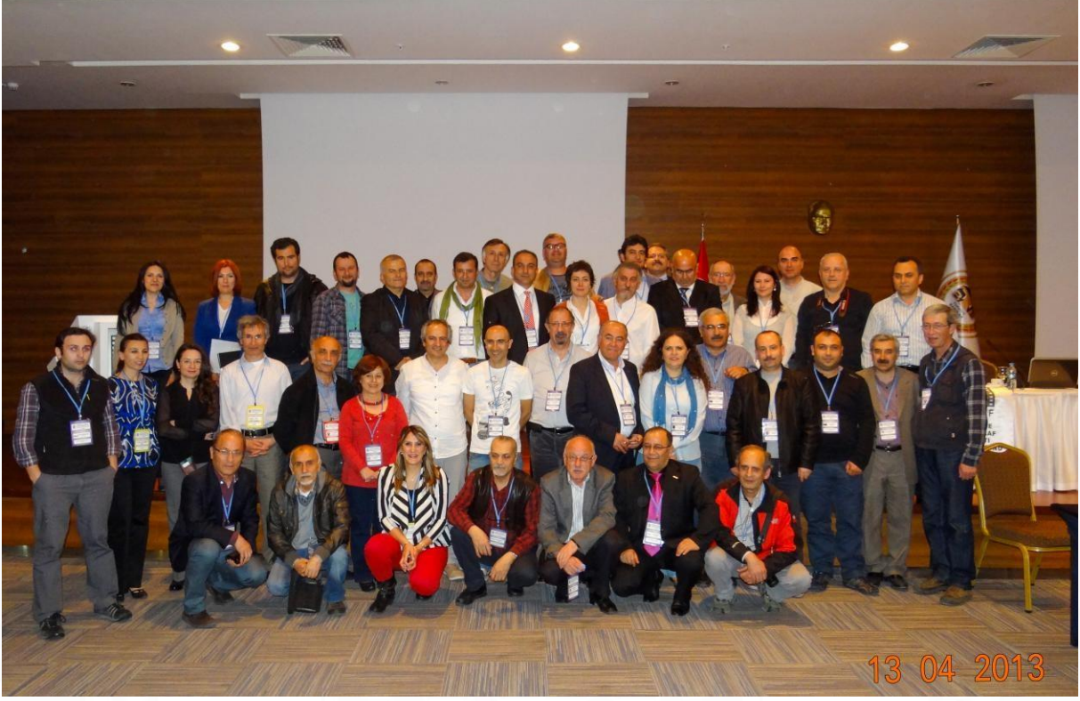
TFSF 6. Olağan Genel Kurul Toplantısı 13.04.2013