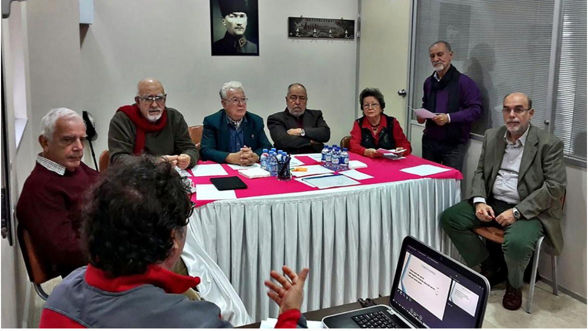
TFSF Türkiye Kupası seçici Kurul Toplantısı