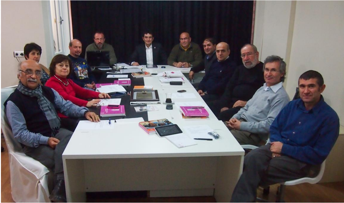
TFSF Yönetim Kurulu Toplantısından - 2013