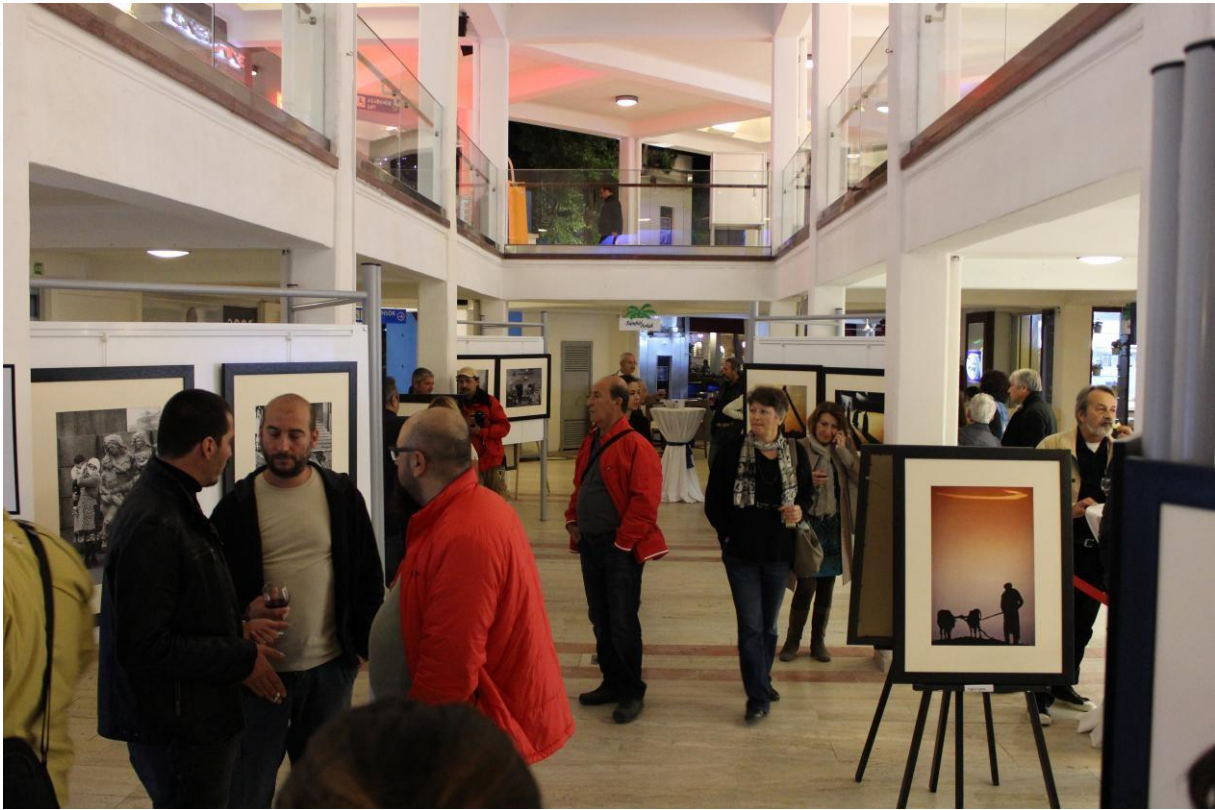
Ustalarımızdan Sergi Açılışı Bodrum - 2015 -