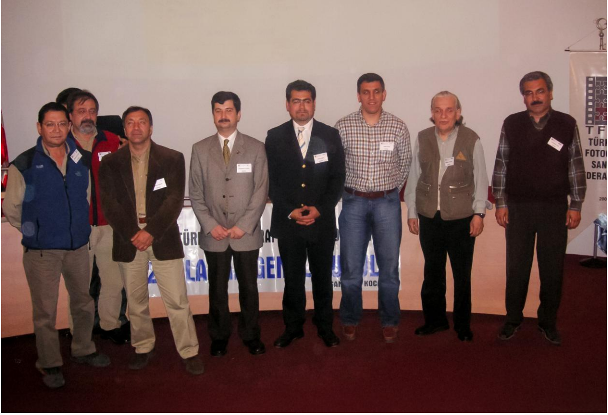
TFSF Kocaeli Toplantılarından -2011 -