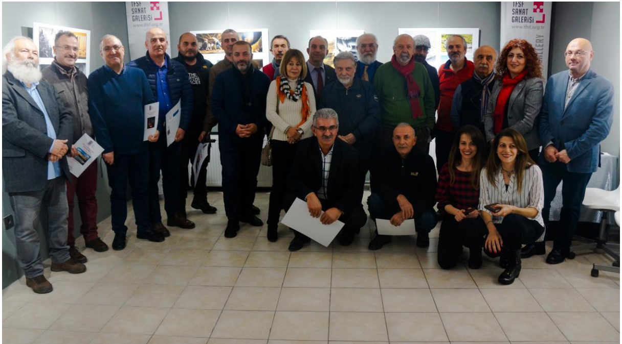
1.TFSF Kupası Sergi Açılışı_04_11_2018