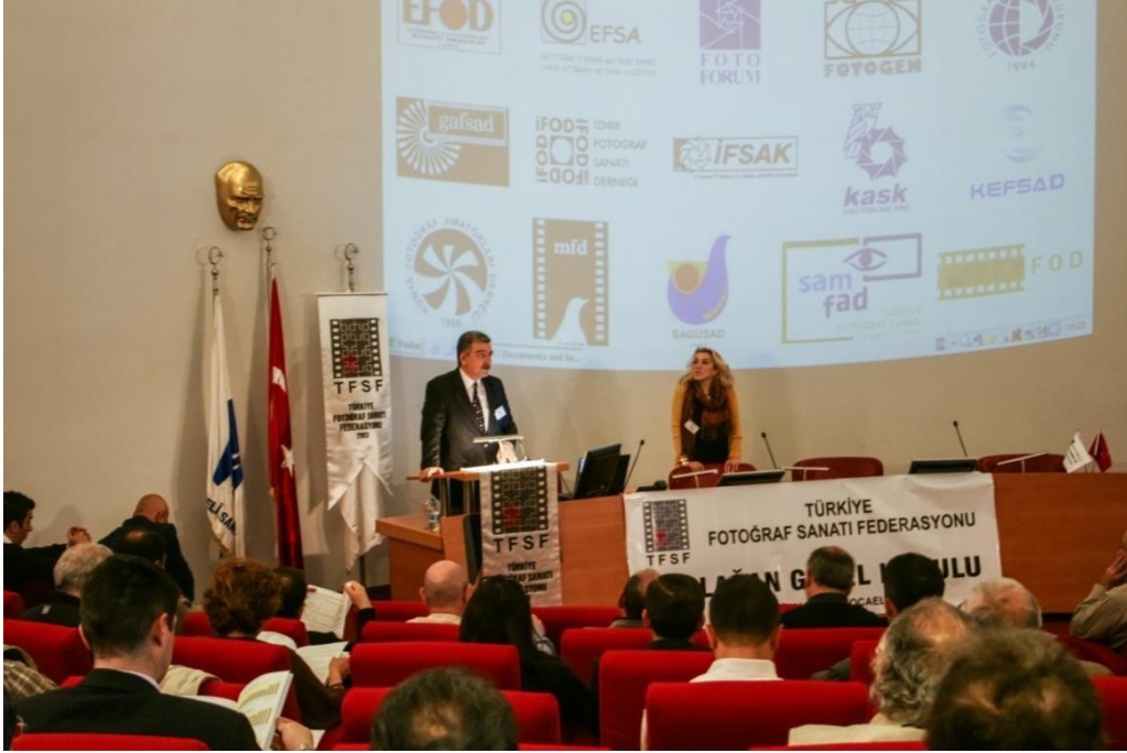
TFSF 4. Olağan Genel Kurulu. - 18.04.2009, - Kocaeli Sanayi Odası Salonu,