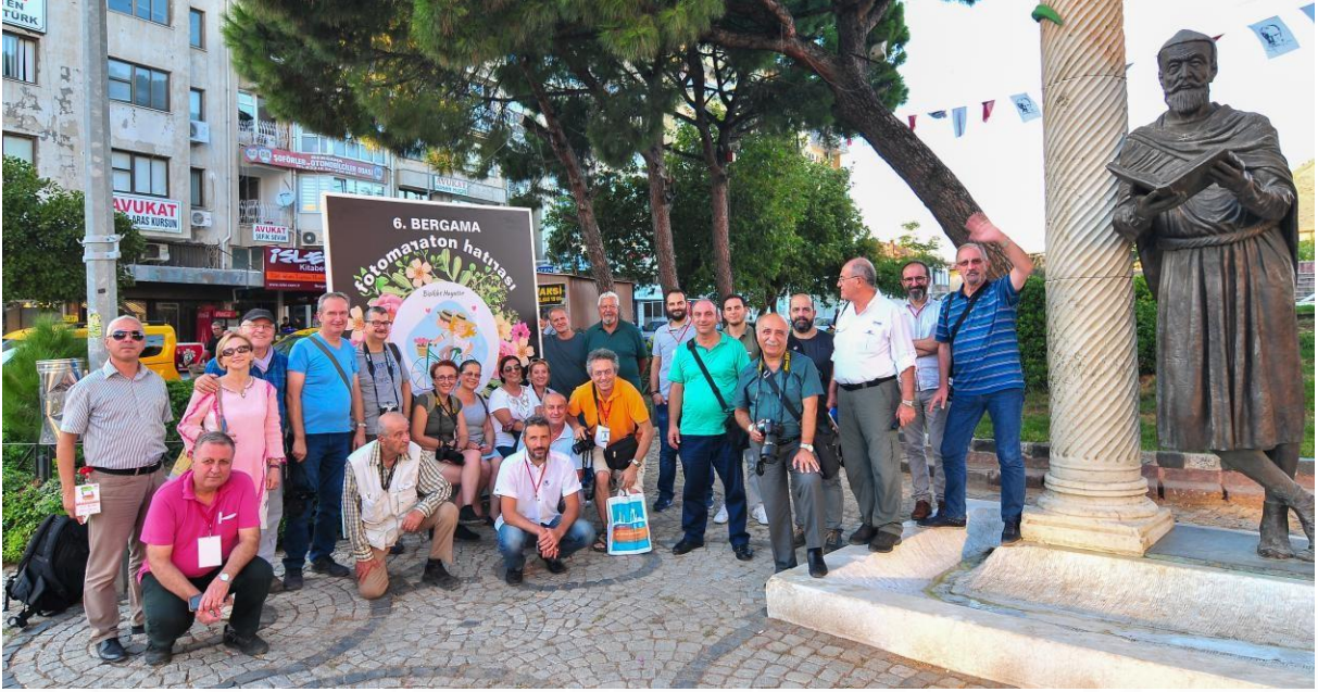
Bergama- TFSF Yönetim Kurulu Toplantısı ve Bergama Fotomaraton_15_09_2017