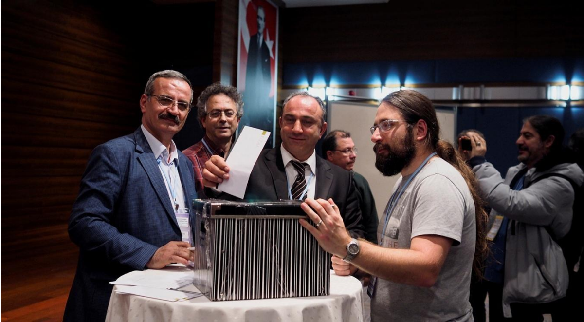
7.Olağan Genel Kurul _13_04_2015