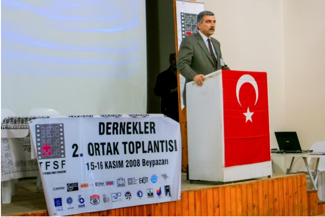
TFSF 2. Dernekler Ortak Toplantısı. - 15 - 16 Kasım 2008 - ANKARA,