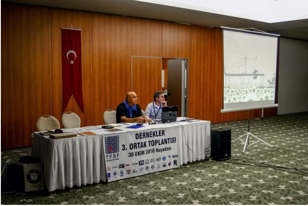
3. Dernekler Ortak Toplantısı - 29-31.10.2010 - Kuşadası,