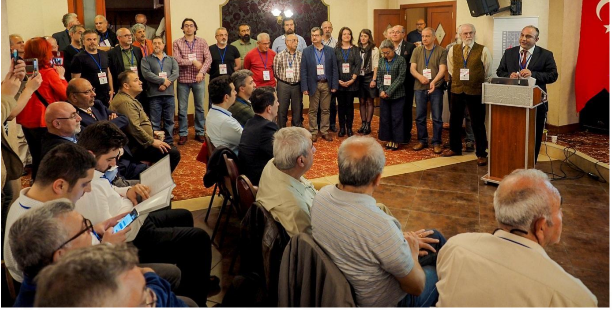
8.Olağan Genel Kurul _06_05_2017