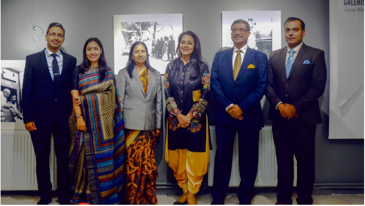
Gandhi Sergi Açılışı - 22.11.2019