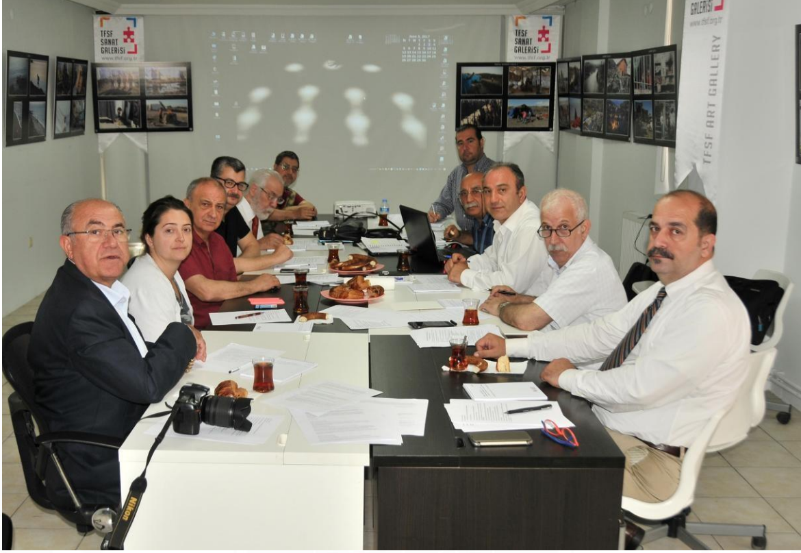
8. Dönem Yönetim Kurulu Toplantısı _06_06_2017