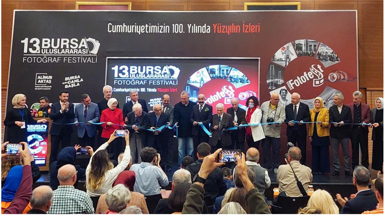
Bursa Fotofest Açılışı ve Başkanlar Toplantısı