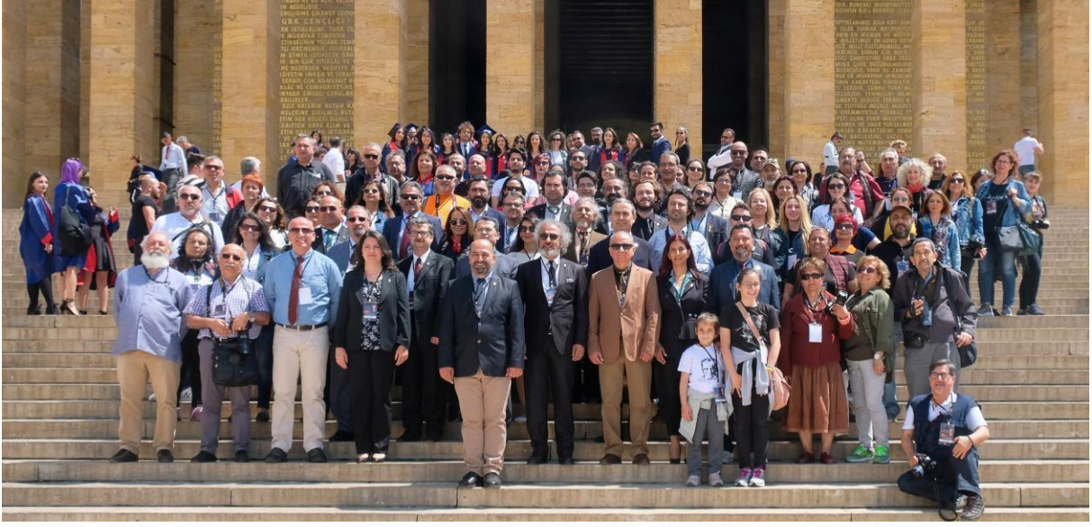
TFSF Yönetim Kurulu Anıtkabir Ziyareti - 2019-2021