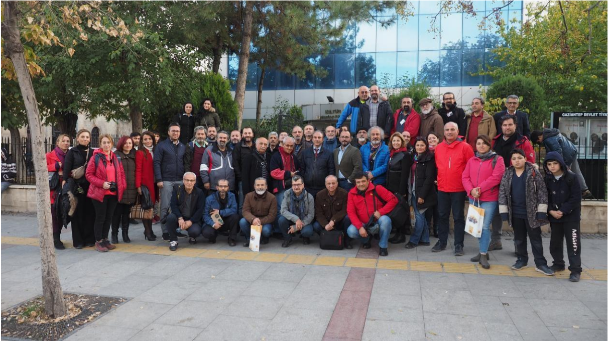
Dernek Başkanları Toplantısı ve Gafsad Sergi Açılışı_Gaziantep_18_11_2018