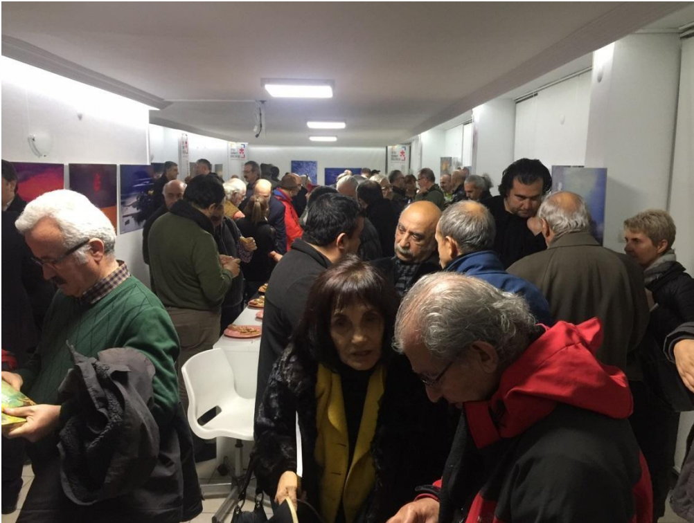
Sıtkı Fırat Retrospektif Sergisi Açılışı