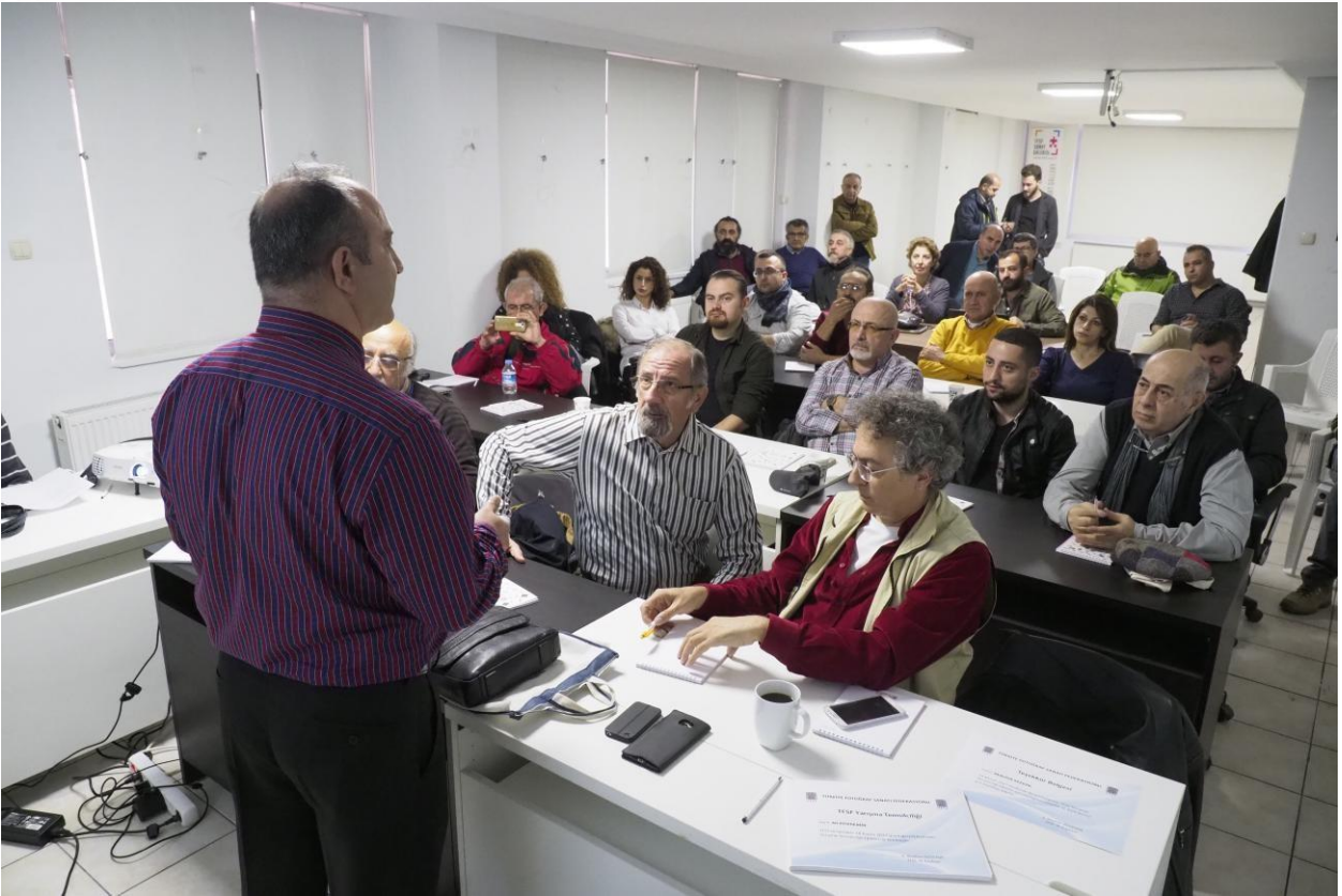
TFSF Yarışma Temsilcileri Toplantısı - 18 Kasım 2017