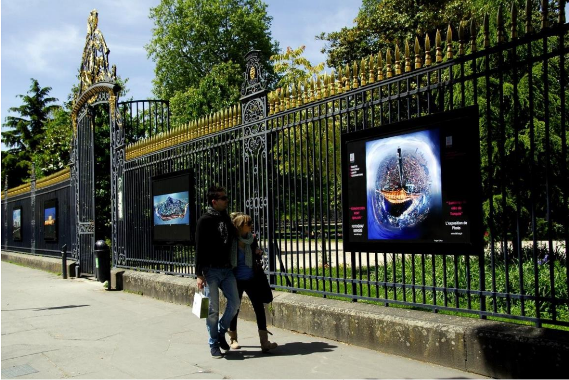
Türkiye'den Kent Işıkları (Fransa Bordo Sergi) - 2014