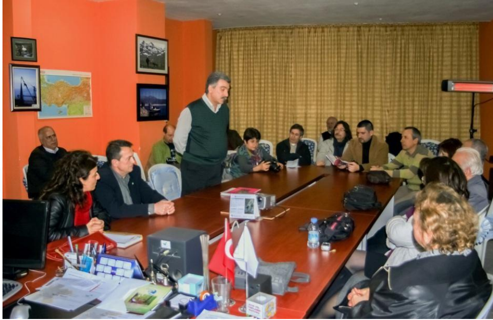
TFSF YK Toplantısı - 20 - 21.03.2010 - Samsun.

TFSF o tarihteki Toplantısını Samsun 'da, SAMFAD 'ın ev sahipliğinde gerçekleştirdi.