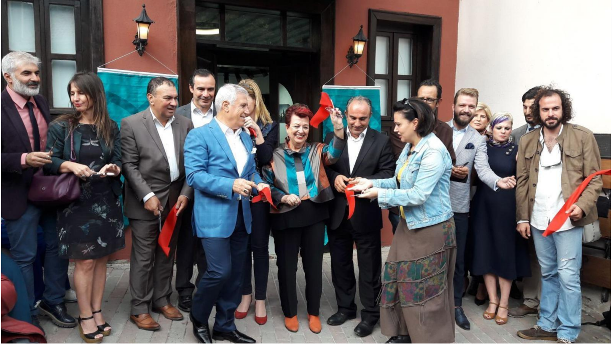
Bursa Nilüfer Belediyesi Fotoğraf Müzesi Açılışı _07.10.2017