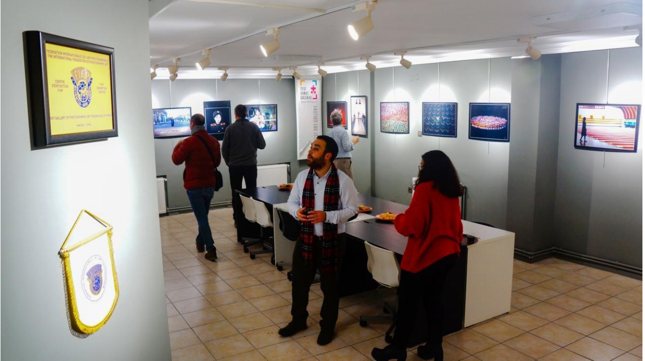
Kuzey Kore Sergi Açılışı - 28.12.2019