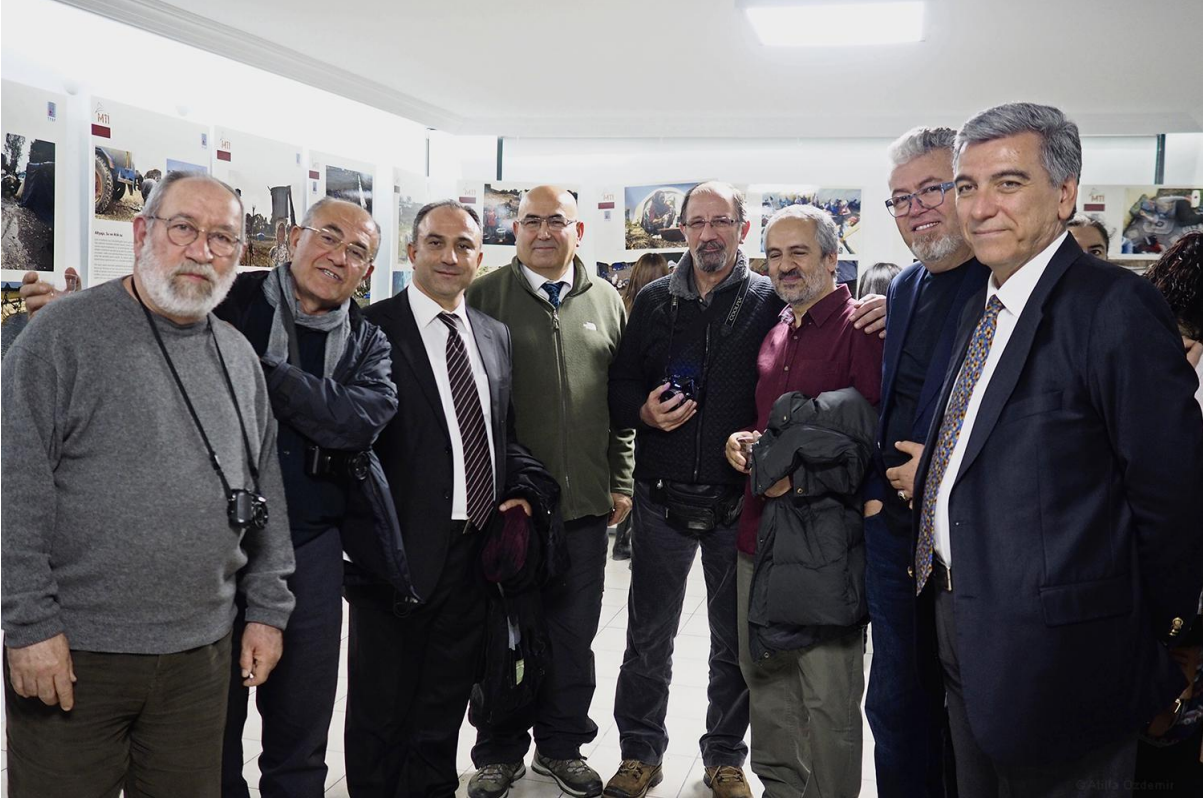
TFSF Galeri - Mevsimlik Tarım İşçileri Projesi Sergi Açılışı 11_04_2015