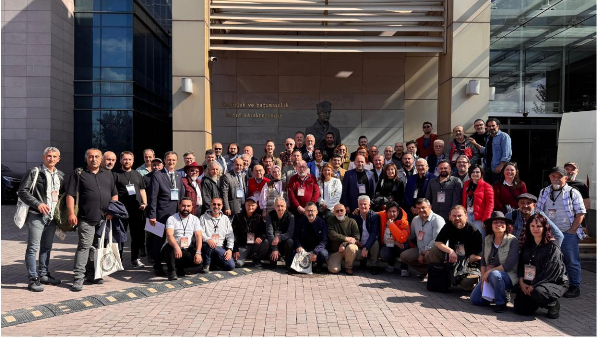
TFSF 11. Olağan Genel Kurul Toplantısı 26.04.2025