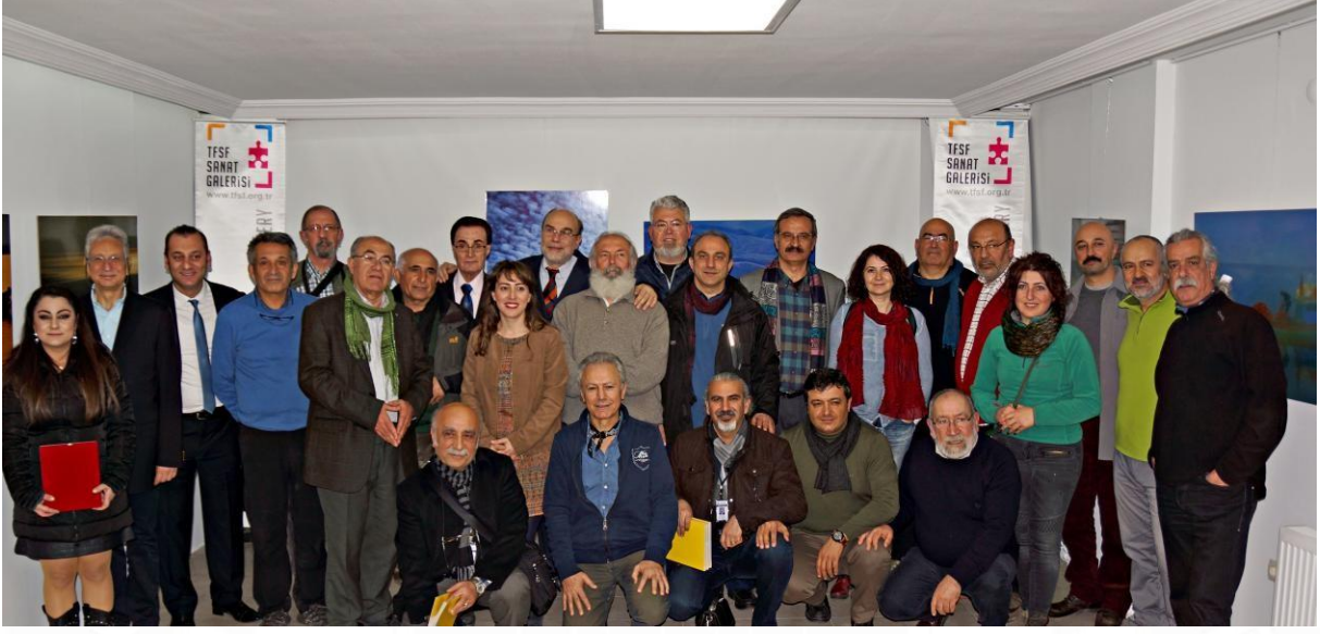
FIAP Galeri Sertifikası Töreni