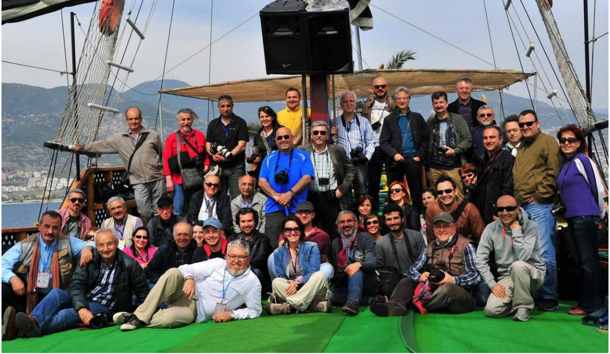
TFSF 5. Dernekler Ortak Toplantısı Alanya - 2014