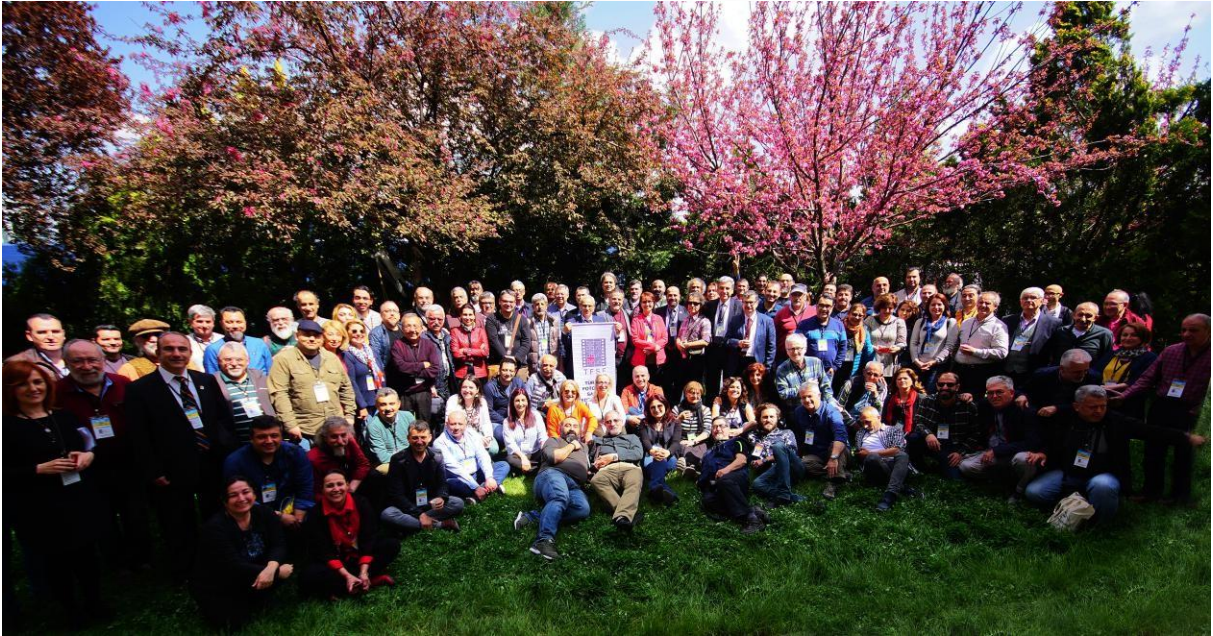
TFSF 9. Olağan Genel Kurul Toplantısı 27.04.2019