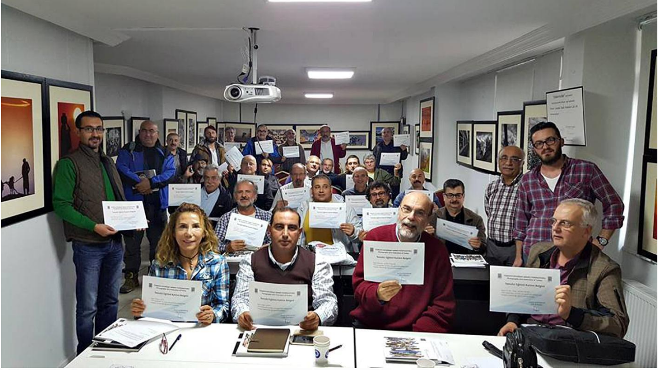
Yarışma temsilciliği Eğitimi 24-10-2015