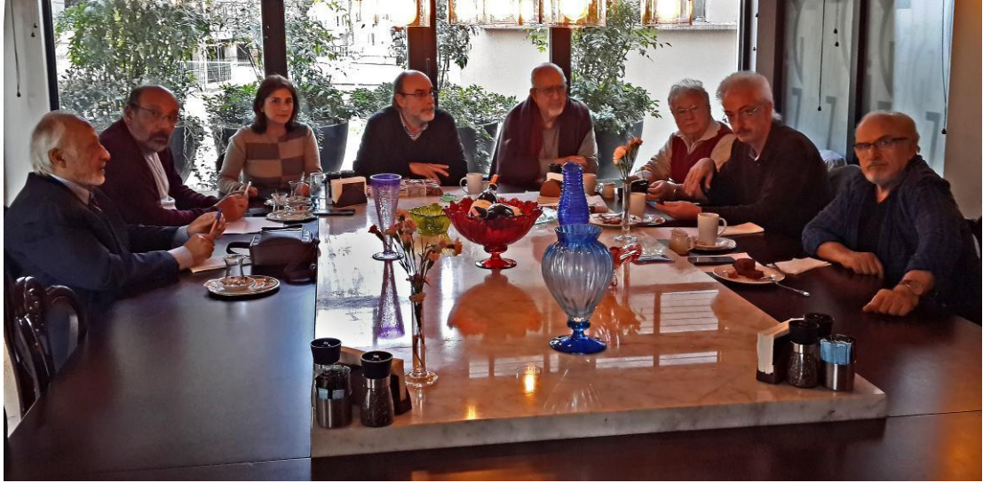
TFSF Danışma Kurulu Toplantısı 21-02-2016

TFSF, sıradan bir örgütlenme değildi. Fotoğrafa gönül verenlerin ortak vizyonunun somutlaşmış haliydi. Bu örgütlenme, fedakar öncülerin, idealist sanatçıların ve fotoğraf aşklarının ortak emeğinin ürünüdür. Her biri bu sanatın gelişmesi için gecesini gündüzüne kattı, ter döktü, emek verdi. Bugün TFSF'nin ulaştığı her başarının ardında bu cesur ve kararlı insanların azmi yatmaktadır.