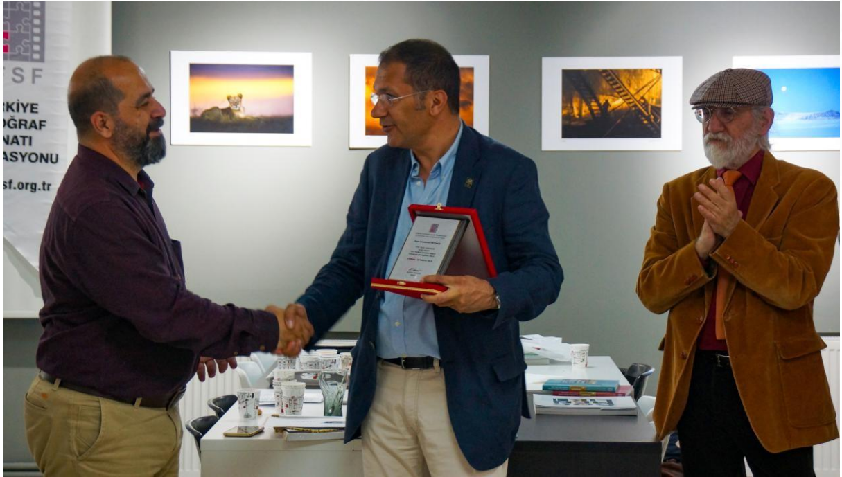
GPU Sergi Açılışı 14.05.2018