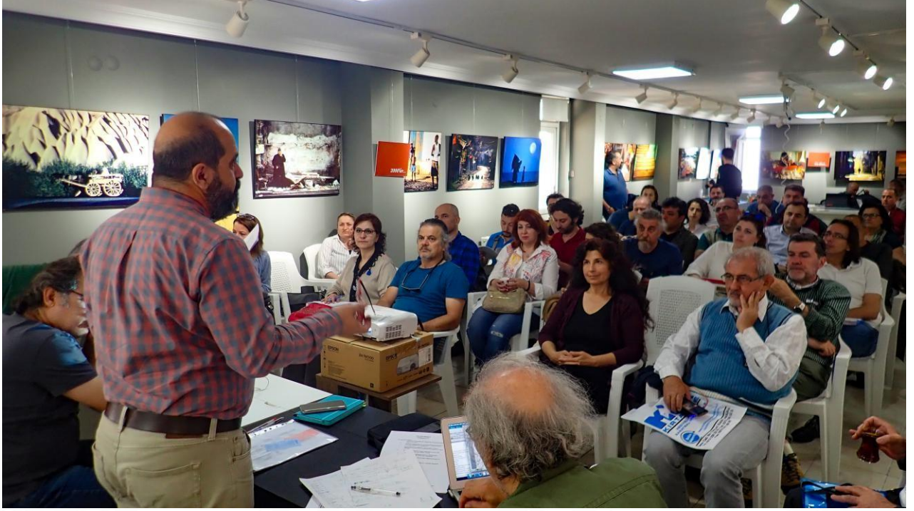
Memleketinden Görsel Hikâyeler Projesi Çalışmaları_09_06_2018