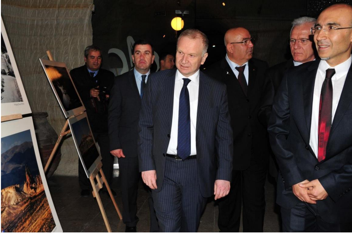
Dünya Fotoğrafçıları Gözüyle Türkiye Sergisi Nevşehir - 2014