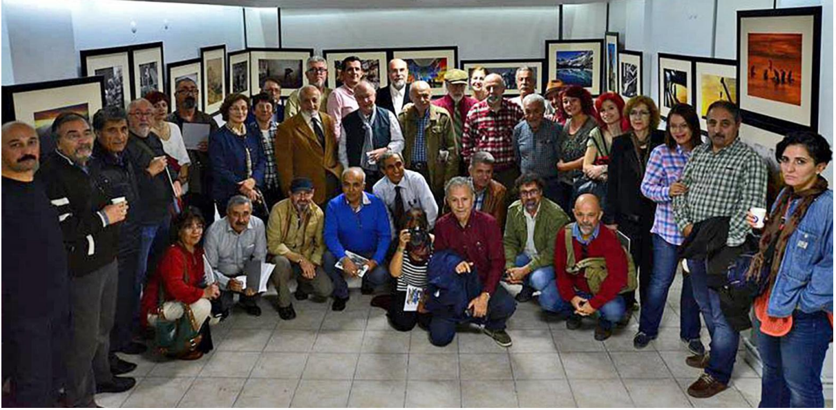
USTALARIMIZDAN Sergisi Açılışı TFSF Sanat Galerisi