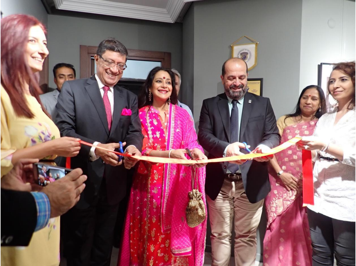
Hindistan Sergi Açılışı - 14.09.2019