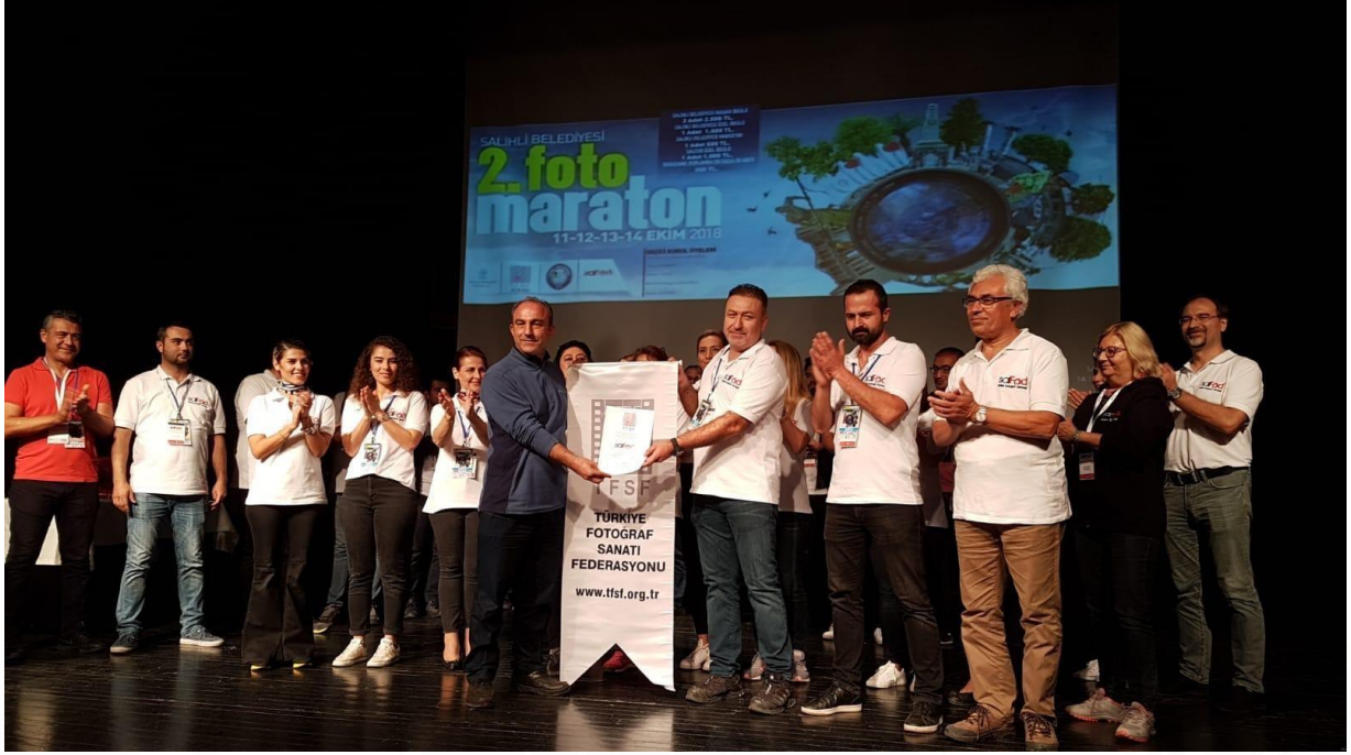
Salihli Fotoğraf Derneği (SALFOD) TFSF Üyelik Töreni_17_10_2018