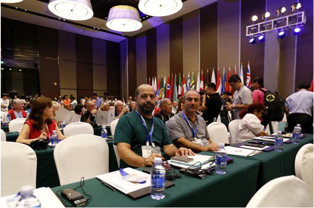
34.FIAP Toplantısı - Çin_14.08.2017