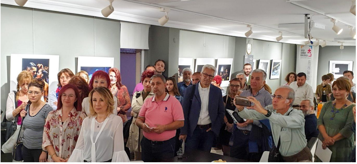
AFSAD - Sahne sanatları ve kişisel dışavurum atölyesi - 05.10.2019