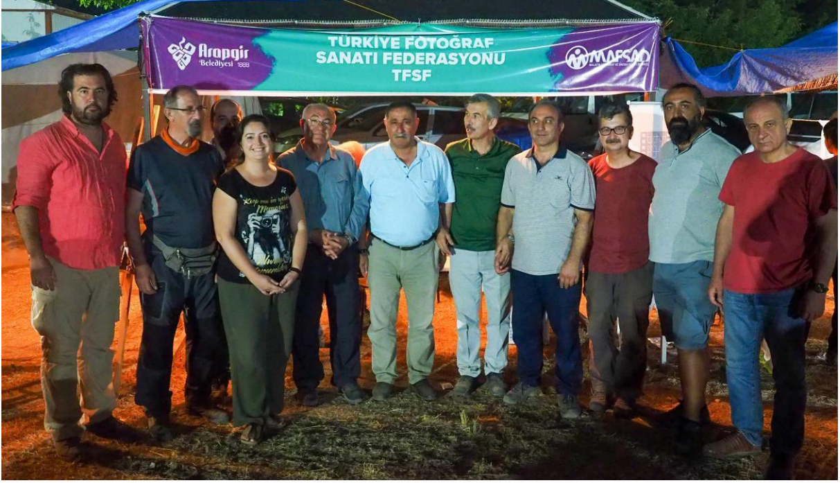
Malatya -Aragir Fotoğraf Kampı_29_06_2018