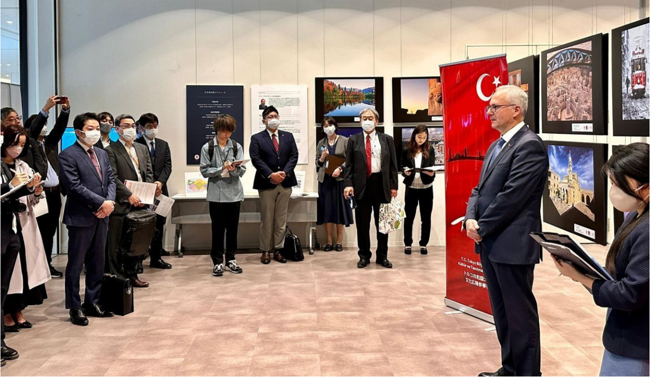
"100. Yılında Türkiye" Sappora Sergi Açılışı- Japonya