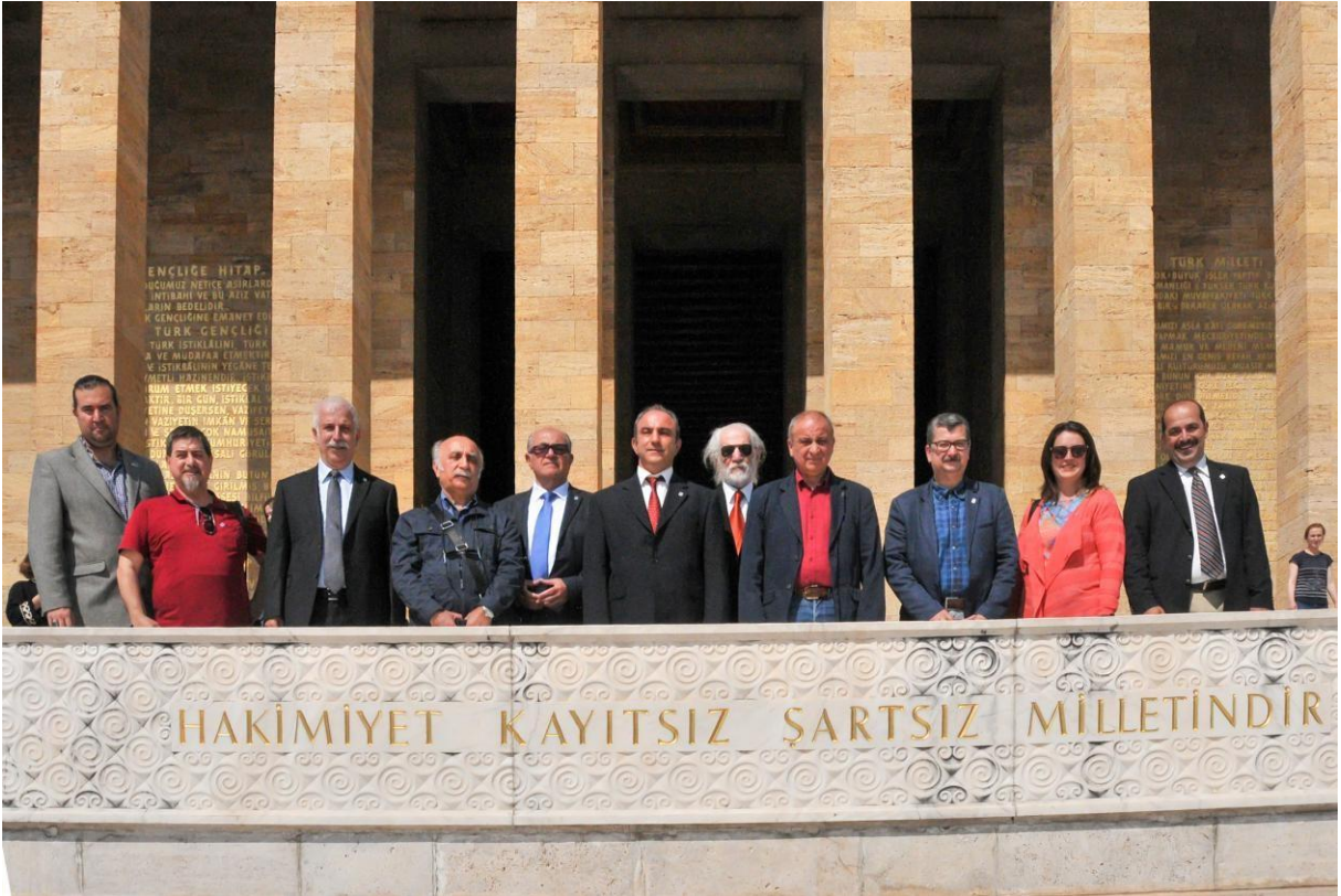
8.Dönem Yönetim Kurulu Anıtkabir Ziyareti _06_06_2017