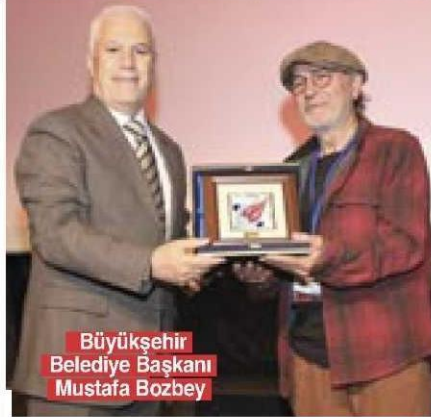
Büyükşehir Belediye Başkanı Mustafa Bozbey

■ Bursa Uluslararası Fotoğraf Festivali, 15. kez kapılarını açtı. Dünya genelinden birçok fotoğraf sanatçısı kente geldi. Büyükşehir Belediye Başkanı Mustafa Bozbey, "Bu yılın teması 'Kınlma Zamanı'; dünyanın ve hayatların farklı dönemlerinde yaşanan kınlınlıkları, dönüşümleri fotoğrafın güçlü diliyle aktarıyor" dedi. ► 4